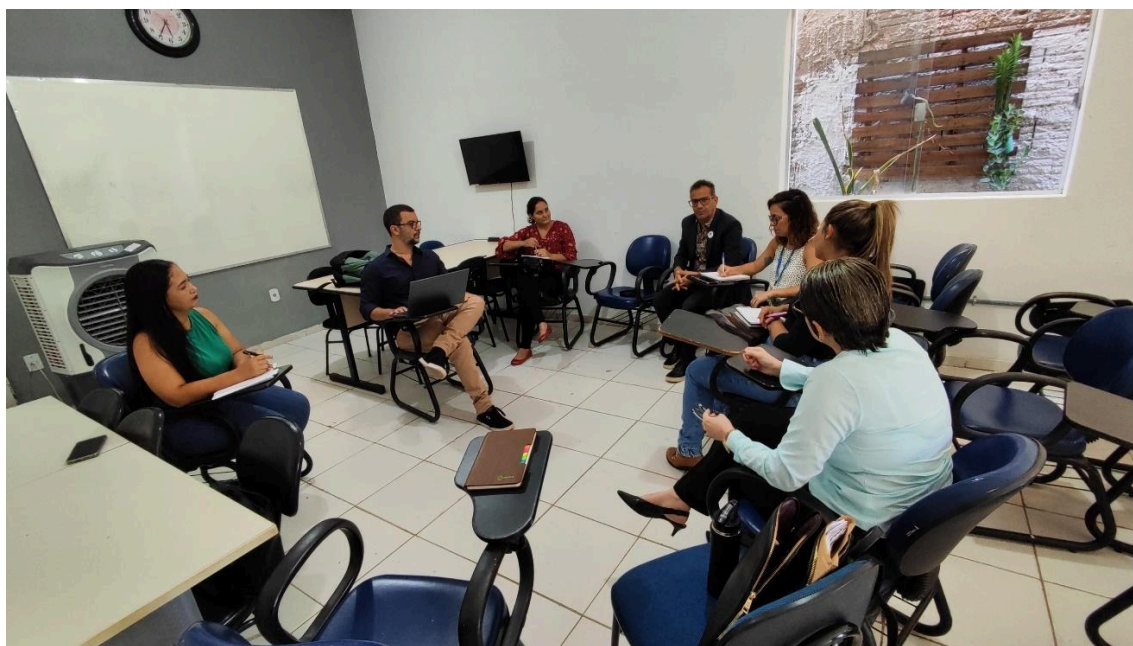
Legenda: Reunião para apresentação do projeto Data: 28/02/2024